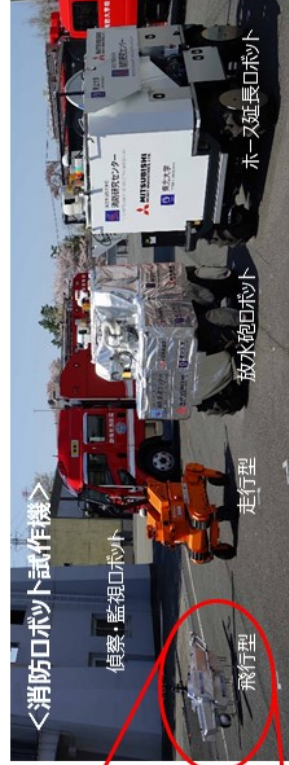
＜消防ロボット試作機＞