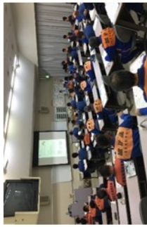
飛行原理、関係法令等の座学の様子