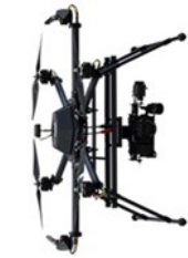
ドローン（偵察活動用資機材）